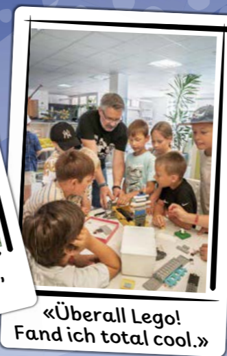
«Überall Lego! Fand ich total cool.»