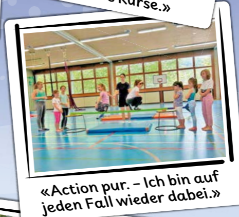
«Action pur. - Ich bin auf jeden Fall wieder dabei.»