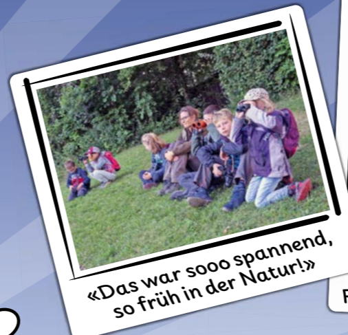
«Das war sooo spannend, so früh in der Natur!»