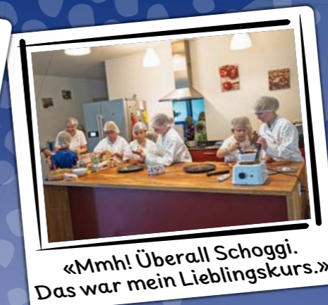
«Mmh! Überall Schoggi. Das war mein Lieblingskurs.»