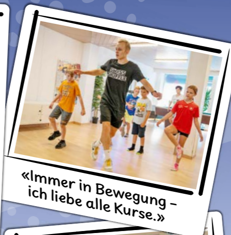
«Immer in Bewegung - ich liebe alle Kurse.»