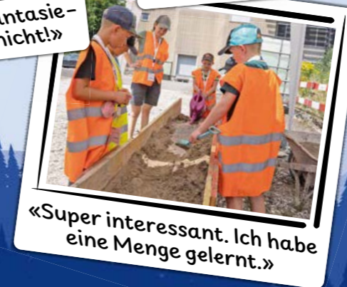
«Super interessant. Ich habe eine Menge gelernt.»

JETZT MITMACHEN! Stunden-, Tages-, Mehrtages- und Wochenkurse ab 6 Jahren.