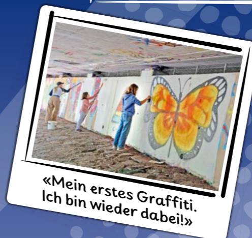
«Mein erstes Graffiti. Ich bin wieder dabei!»

Sommer... Ferienpass-Zeit ... los geht's!