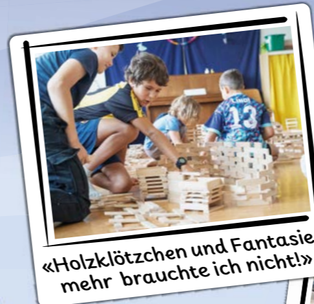
«Holzklötzchen und Fantasie - mehr brauchte ich nicht!»